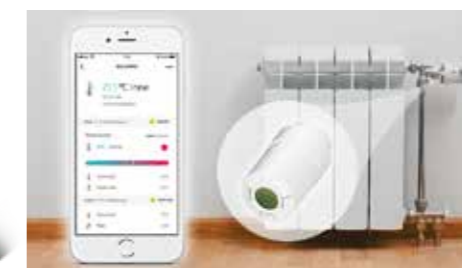
RINGBO magasinet · nr. 4 2019