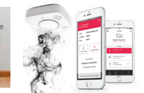
RINGBO magasinet · nr. 4 2019